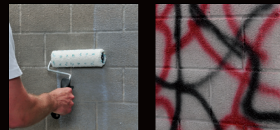
Zolpan 420 - Protection SG felvitele