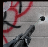
Protection SG nyomás alatti graffiti lemosás